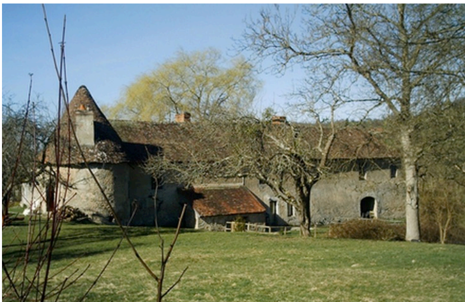
Façade arrière des communs du château d'Alone-Toulangeon.

Lors de la précédente campagne de travaux, nous avons procédé au relevé en plan du niveau 0, le rez-de-chaussée. Cette année, à la demande de Monsieur Demetz, nous avons poursuivi les relevés au niveau 1. Toutes les pièces composant cet étage ont été mesurées et dessinées.