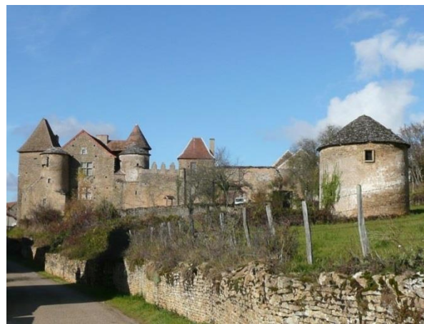
Château Pontus de Tyard Bissy-sur-Fley