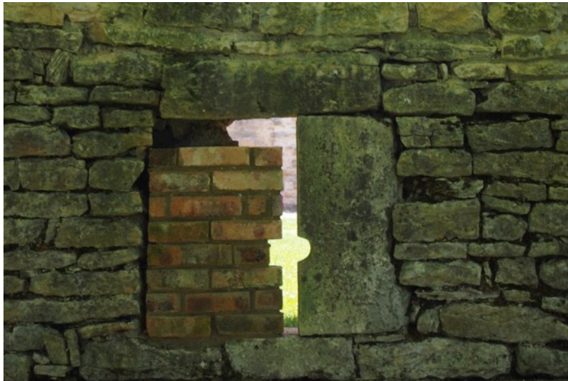
Cliché 14 – Jambage remonté de l'archère-canonnière 14, vue de l'extérieur.

Nous avons maçonné en briques les deux jambages manquant aux archères canonnières 15 et 14, puis nous avons harmonisé la maçonnerie des arrachements de la courtine du côté est. Enfin, nous avons reposé les pierres sur l'arase de la courtine.