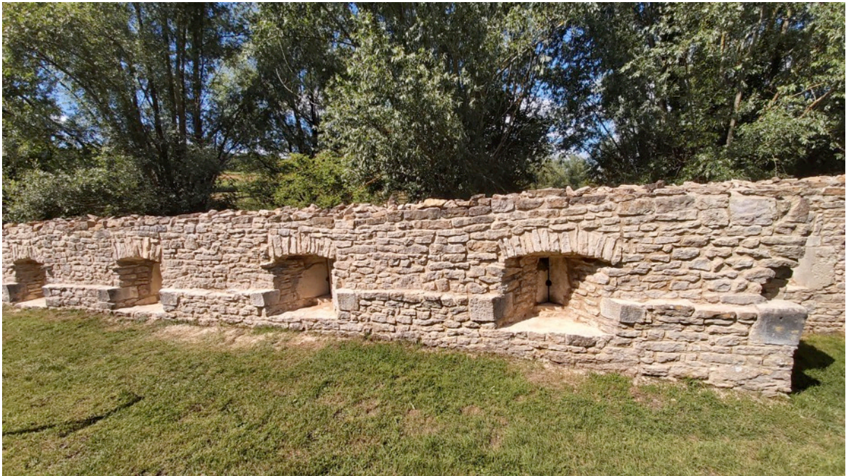
Cliché 16 – Autre vue de la courtine une fois les jointoiments terminés.