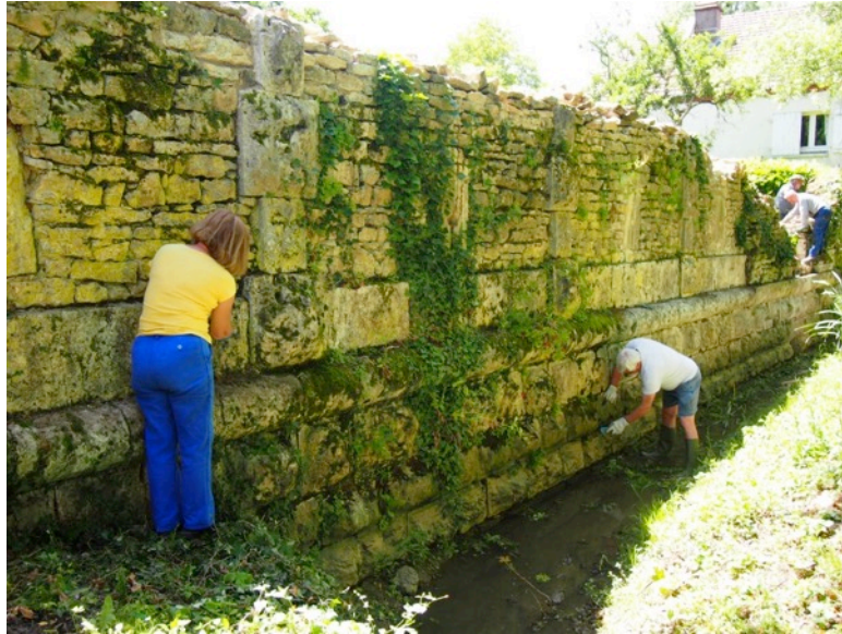
Cliché 4 – Dévégétalisation de la courtine à cordon d'escarpe.