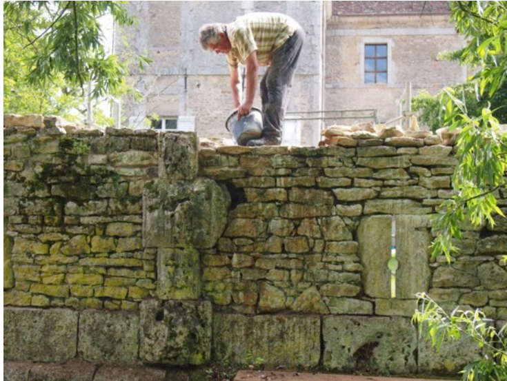
Cliché 9 – Maçonnerie de l'arase de la partie supérieure de la courtine.