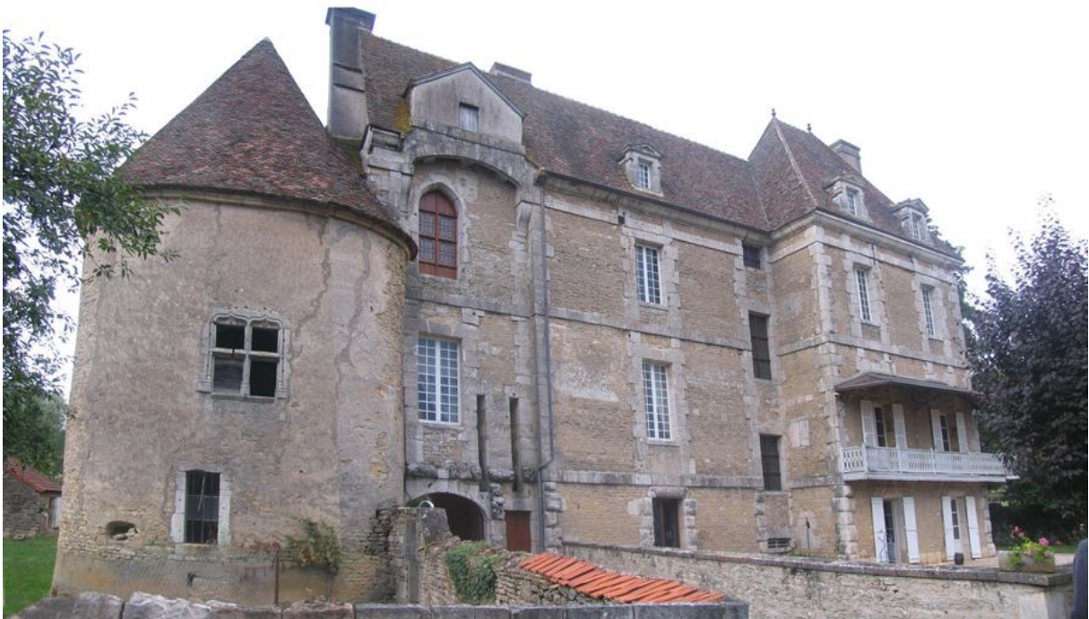
Château de Chamilly.