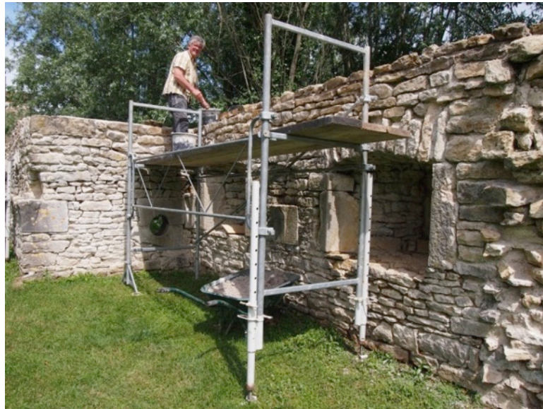
Cliché 7 – Remontage de la courtine