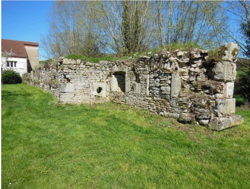
Cliché 2 – Etat de la courtine à cordon d'escarpe avant restauration, vue de l'intérieur.