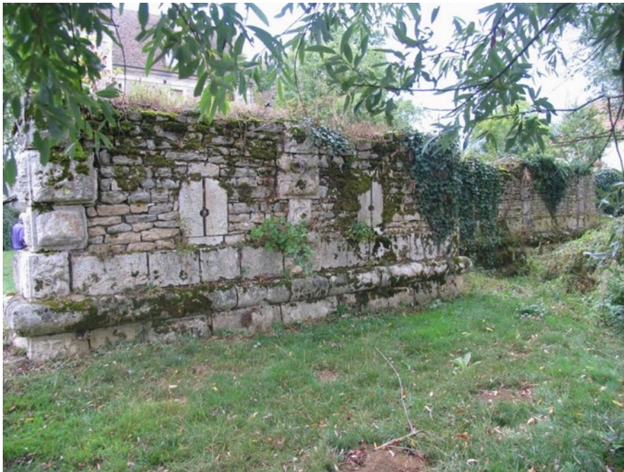
Cliché 1 – Etat de la courtine à cordon d'escarpe avant restauration vue du nord, face externe.

Cette étude a montré qu'au nord du château actuel existaient les vestiges d'une enceinte quadrangulaire avec pavillons et galerie voûtée. Sur le côté nord de cette enceinte, la courtine était fortement dégradée, les pavillons et la galerie ayant disparu, ne subsistant que les reliques ou traces d'une dizaine d'archères-canonnières et les arrachements d'un mur perpendiculaire côté est. Du côté extérieur, cette courtine présente encore entre ces archères-canonnières une succession de beaux pilastres à bossages, sous lesquels court un cordon semi-circulaire.