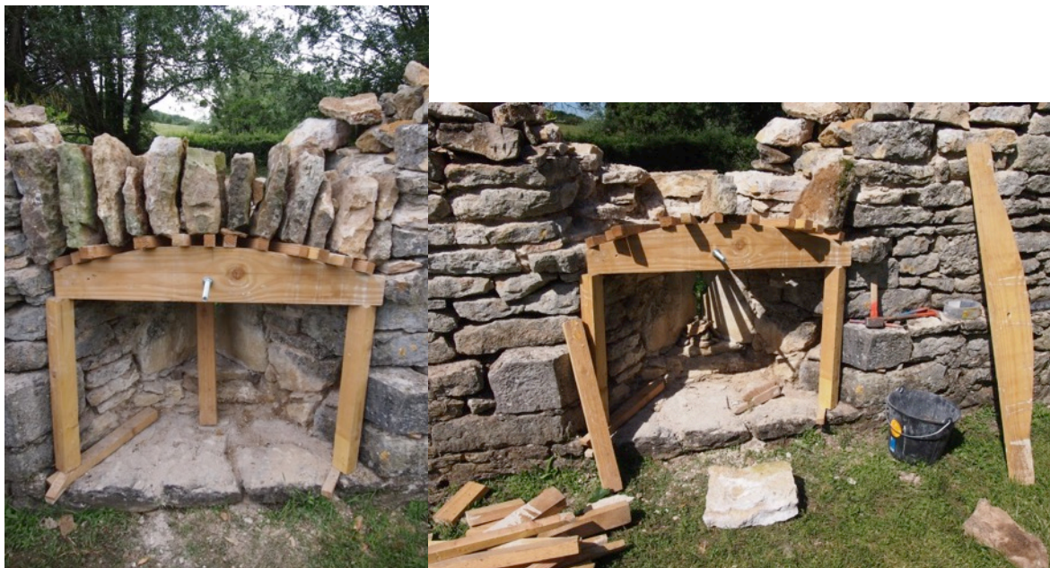
Clichés 5 et 6 – Fabrication et pose des vaux en bois.