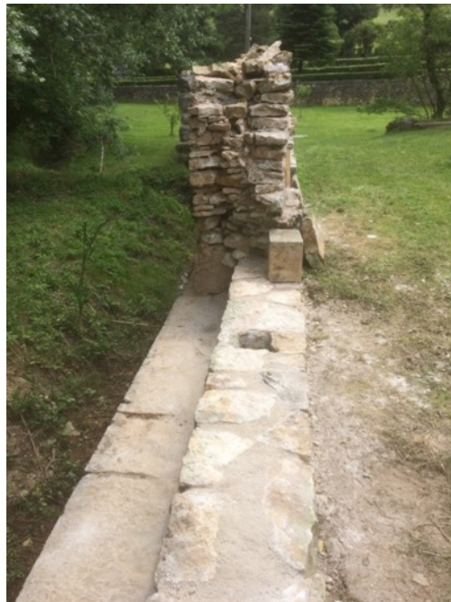
Cliché 10 – Construction du petit muret avec trous de fixation pour une future barrière.

Les travaux se sont poursuivis du lundi 17 au vendredi 21 juin 2019. L'équipe bénévole du CeCaB a surtout travaillé à la reconstruction des voûtes des chambres de tir 14, 15 et 16, à l'arasement d'une partie supérieure de la courtine et à la reconstruction du petit muret de 50 centimètres de largeur pour une hauteur de 40 centimètres barrant un ancien accès, afin de retenir la terre de la terrasse et d'y installer à l'avenir une barrière métallique de sécurité.