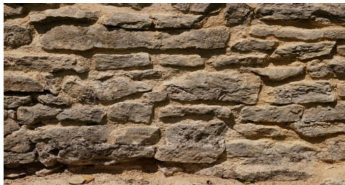
Cliché 3 – Couleur des joints retenue pour le jointoiment de l'intérieur de la courtine.

En mai 2018, des essais de texture et coloration du mortier ont été effectués sous la direction de Monsieur Dessons.