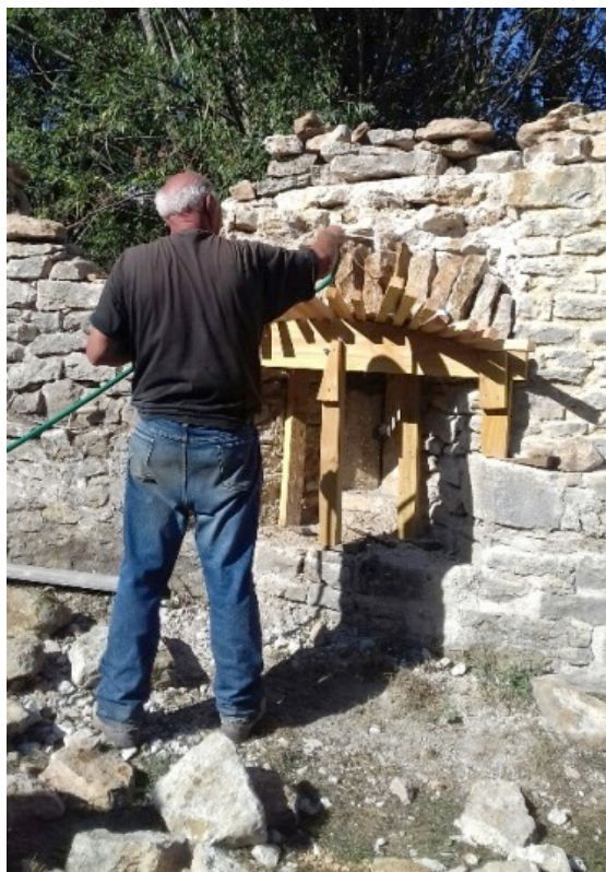
Cliché 8 - Humidification avant remontage des claveaux de la voûte