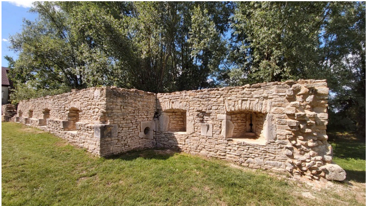
Cliché 15 – Vue intérieure de la courtine à cordon d'escarpe une fois les consolidations achevées.